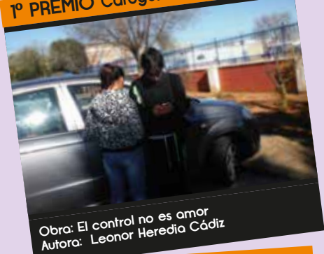
Obra: El control no es amor Autora: Leonor Heredia Cádiz