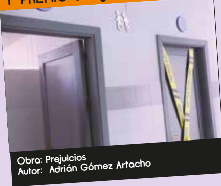
Obra: Prejuicios Autor: Adrián Gómez Artacho